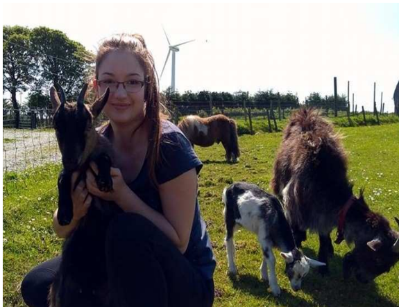
Londonderry, Irlandia Północna 2016 -2017