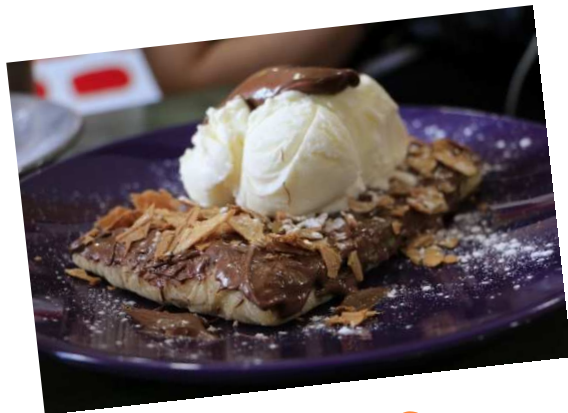
TRIPAS - portugalskie naleśniki