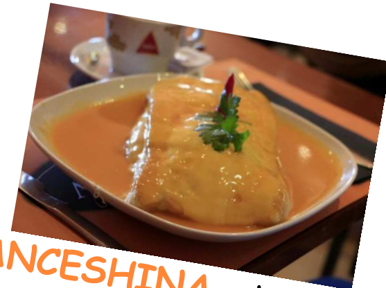
FRANCESHINA - tosty przekładane mięsem w sosie piwnym