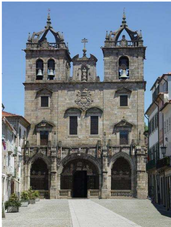
Se Catedral de Braga

To jedno z najstarszych miast w Portugalii o ponad 2000-letniej historii oraz jedno z najstarszych miast chrześcijańskich na świecie.