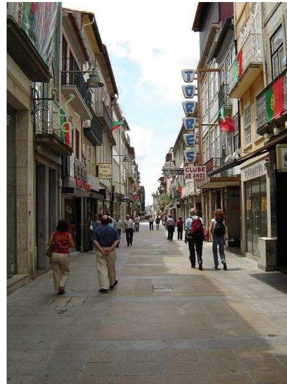
Rua do Souto

To jedno z najstarszych miast w Portugalii o ponad 2000-letniej historii oraz jedno z najstarszych miast chrześcijańskich na świecie.