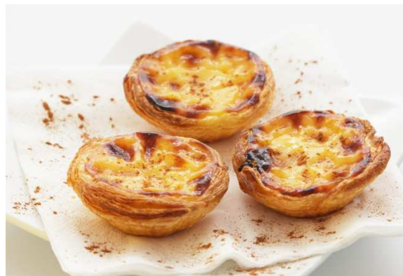
PASTEIS DE NATA - bułeczki z kremem budyniowym