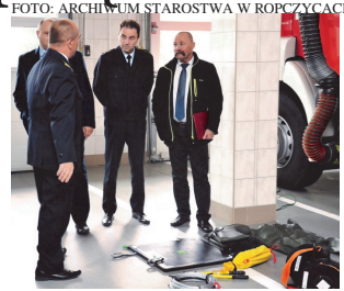
Aksesoria zostały kupione

ROPCZYCE ▶ W środę, 12 października strażacy z Komendy Powiatowej Państwowej Straży Pożarnej dostali od starostwa powiatowego specjalistyczny sprzęt. Nowe wyposażenie ropczyckiej jednostki to m.in. ściągacz linowy, nożyce ratownicze, nagrzewnica czy agregat prądowoczą.