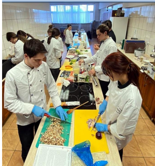
Kurs FINGER FOOD przeprowadzony w naszej szkole w ramach projektu