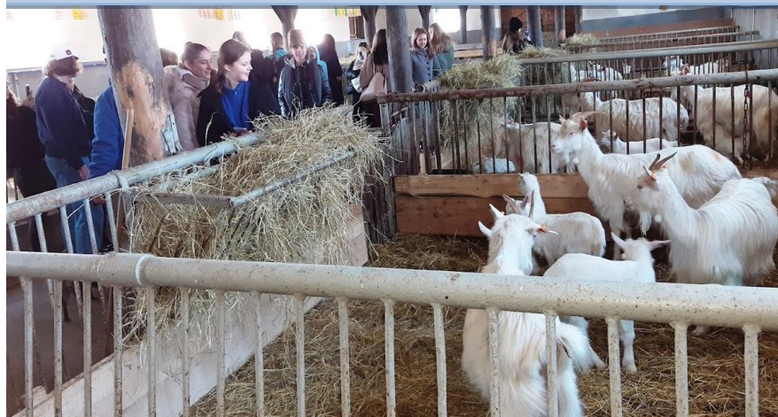
Wyjazd studyjny do ZAKŁADU DOŚWIADCZALNEGO IZ PIB W ODRZECHOWEJ

5 kwietnia uczniowie Technikum Weterynarii zwiedzali Zakład Hodowli Drobiu, Drobno Inwentarza, Owiec i Kóz oraz Zakład Biologii Molekularnej Zwierząt, a także Laboratoria Genomiki i Genetyki Molekularnej, Pracownię Proteomiki i Pracownię Cytogenetyki. Mieli okazję też podziwiać imponującą hodowlę ślimaków oraz koralowców.