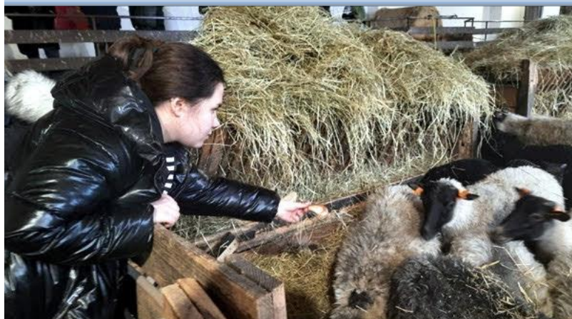
Wyjazd studyjny do INSTYTUTU ZOOTECHNIKI W BALICACH /k. KRAKOWA